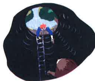
Titelbild von Miel Delahajj: „Mit langer Leiter und beherzten Menschen aus dem Loch heraus“

Universität Zürich Institut für Erziehungswissenschaft Bibliothek Freiestrasse Freiestrasse 36 8032 Zürich