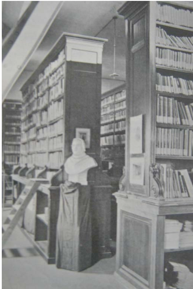
Bibliothek in der Freiburger Schulausstellung

Im katholischen Freiburg waren die Gründungszusammenhänge insofern komplexer, als das musée pédagogique Teil eines ambitionierten Plans des Freiburger Erziehungsdirektors Rafael Horner wurde, die katholische Pädagogik in der Schweiz zu modernisieren und zu verbessern. Die Schulausstellung stand deshalb ebenso im Dienste der Aus- und Weiterbildung katholischer Lehrer in der Schweiz wie die 1889 gegründete katholische Universität (Lussi & Cicchini, 2007).