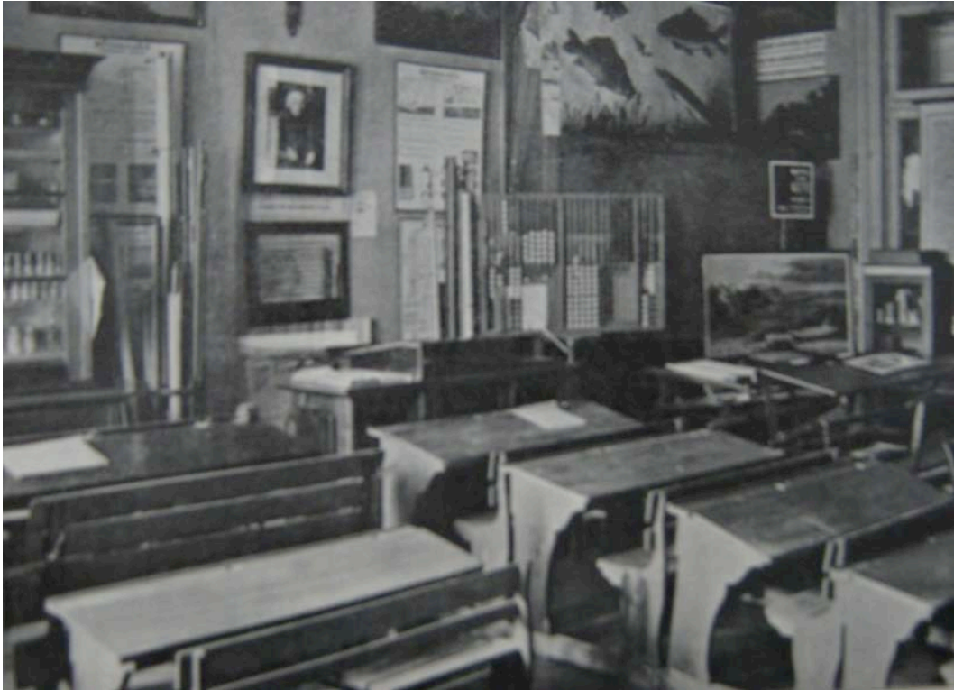
Modellschulzimmer Freiburg

Alle drei Schulausstellungen gaben eine Zeitschrift heraus oder beteiligten sich massgeblich an der Herausgabe einer solchen: Die Zürcher Schulausstellung publizierte zunächst das Korrespondenzblatt, ab 1880 das Schweizerische Schularchiv ; die Berner publizierten ab 1880 den Pionier mit dem Konterfei Fellenbergs auf der Titelseite; die Freiburger Schulausstellung beteiligte sich 1884 an der Herausgabe des Bulletin Pédagogique , einer katholischen Gegen gründung gegen den liberalen und protestantischen Educateur , der Zeitschrift des Westschweizer Lehrervereins.